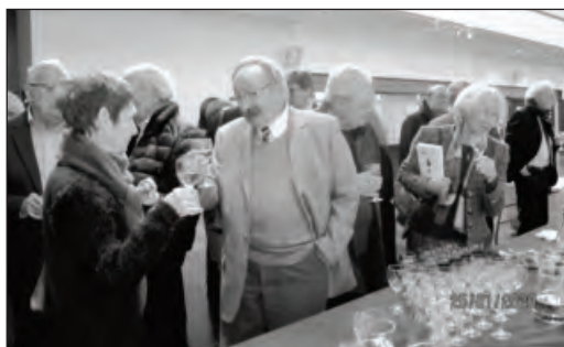
Moment de convivialité.