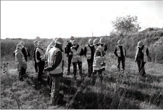
Essai pilote de constitution de pelouse calcaire sèche