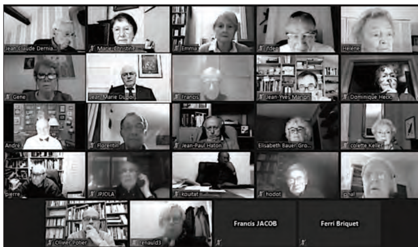
Sur écran, une partie des participants lors de la séance visio du 12 novembre 2020