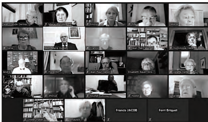
Une partie des auditeurs