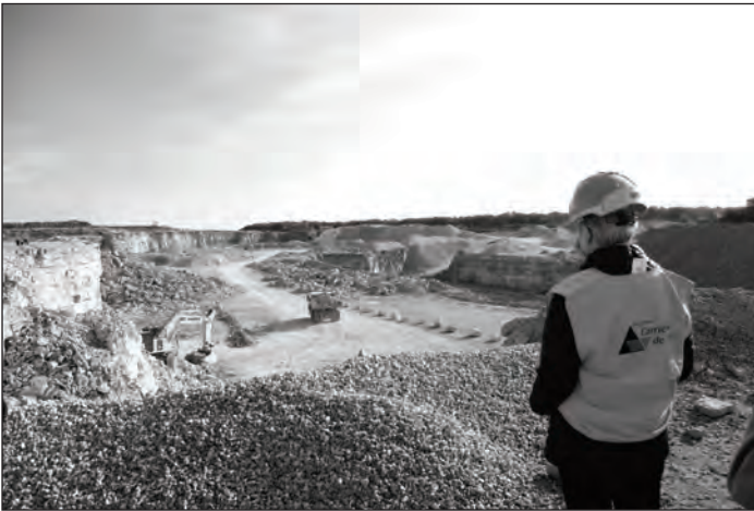
Travaux d'exploitation de la carrière