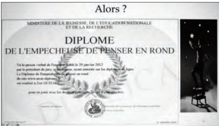
“Tant qu’on a de l’humour, à offrir en partage...”