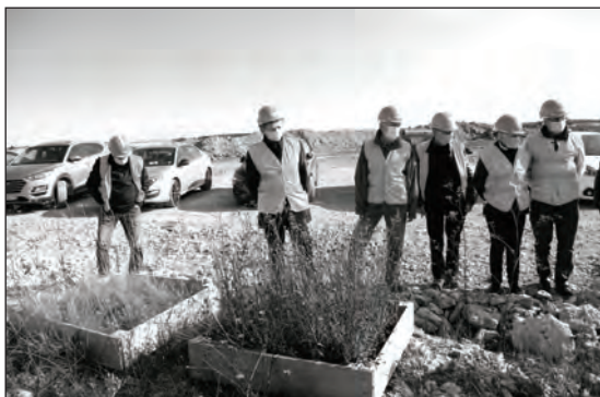
Site d'expérimentation, essai de semis sur bacs